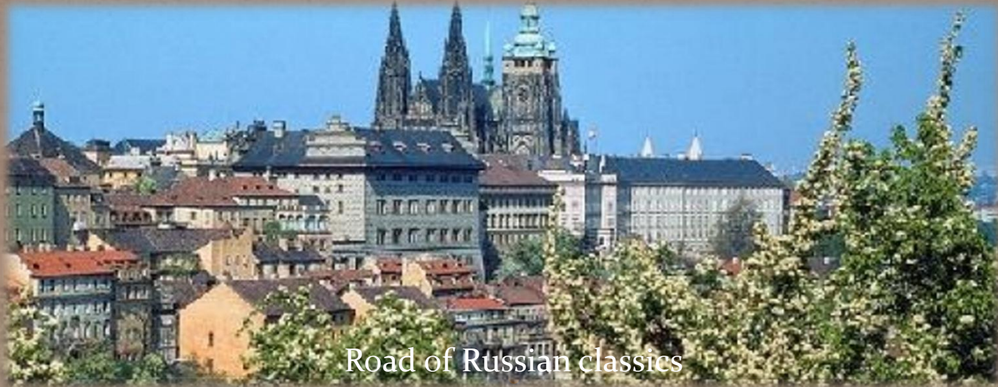
Road of Russian classics